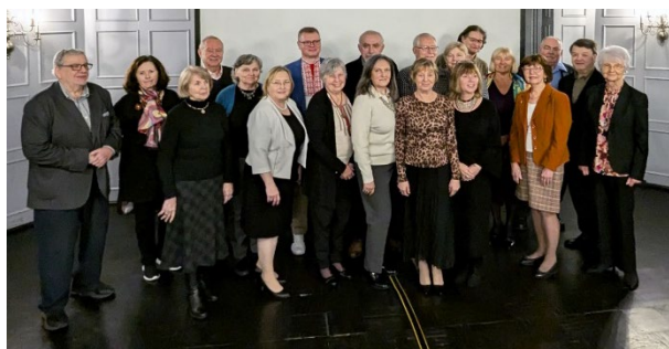
Члени дирекції НТШ різних років на 4-ій сесії ювілейної конференції

На закінчення, дякую від усього серця всім членам Дирекції та членам НТШ за їхню працю та зусилля в справі плекання, розвитку та поширення українознавства в Канаді і світі.