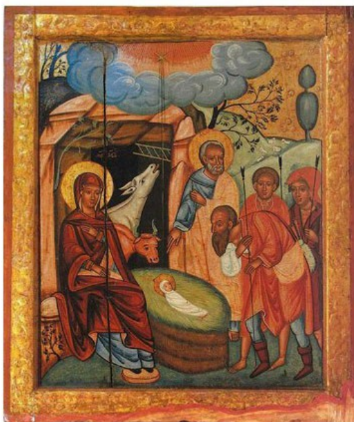
Різдво Христове. Село Сколе. Маляр ікони Богородиці Дороговазниця з Мражниці. Поч. 17 ст. Національний музей ім. А. Шептицького у Львові.