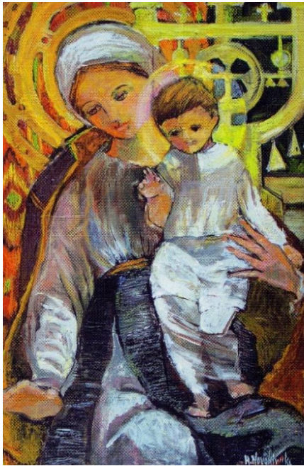
Галина Новаківська, Різдво